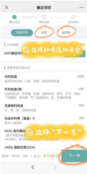
选择“加项”或“加项包”（若无需加项请直接选择下一步）