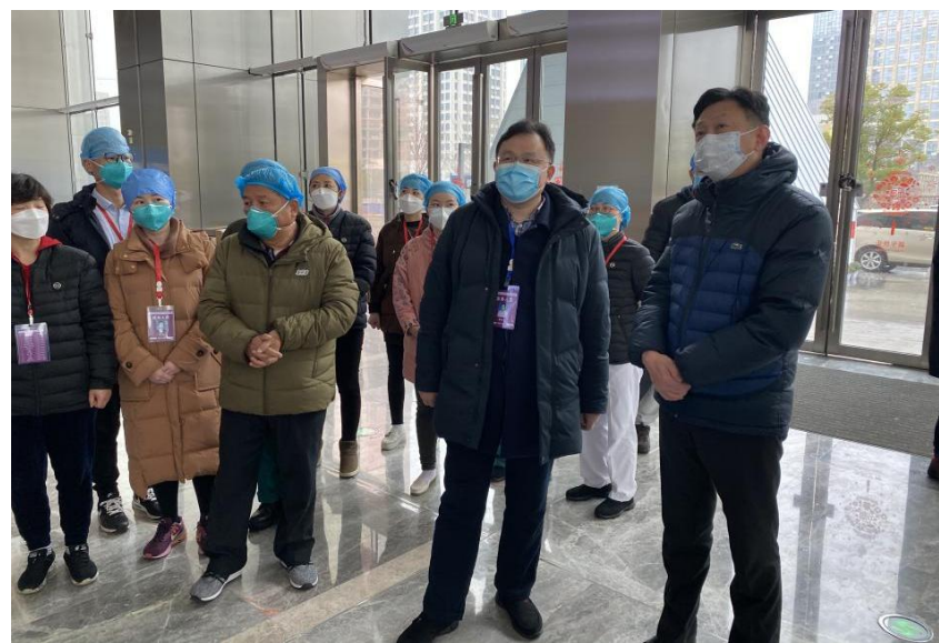
3月6日，光谷方舱顺利休舱，共收到患者或患者家属感谢信200余封，收治病人875人。休舱当天，国家卫健委主任马晓伟也来到光谷方舱医院，听取汇